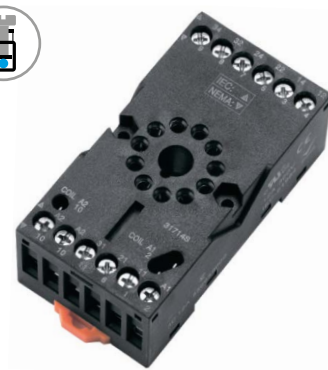
KS-R 3CO Схема соединений