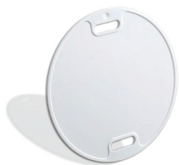
Бирка пластиковая маркировочна