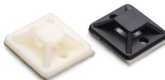
Площадки монтажные самоклеящиеся