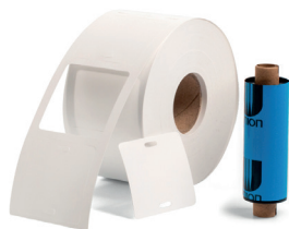
Комплект «Бирка-рибон» для маркировки кабеля