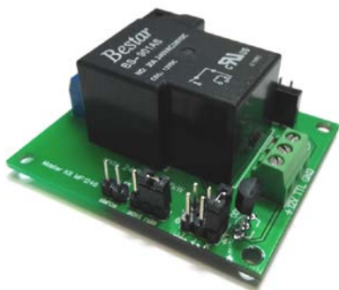
Общий вид устройства

Модуль будет полезен для проектов пользователей на базе микроконтроллеров и плат Arduino и Raspberry.