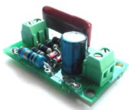
Общий вид устройства

Данный модуль разработан специально для устройств из каталога мастер кит ВМ8039, ВМ8039D и ВМ8036. Но с успехом может использоваться с любой домашней автоматикой и сигнализацией. Устройство имеет оптогальваническую развязку, это дает возможность подключать модуль непосредственно к выводу микроконтроллера. Модуль будет полезен для проектов пользователей на базе микроконтроллеров и плат Arduino и Raspberry.